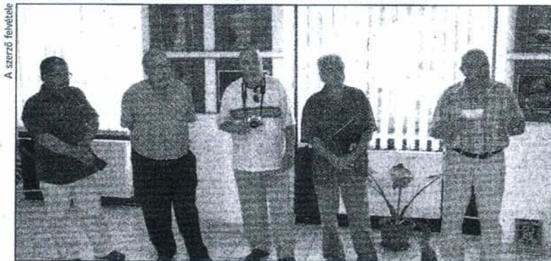
Augusztus 22-ig tekinthető meg a kiállítás Nagyváradon