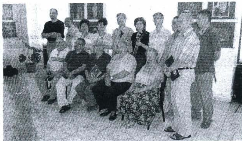
Egy közös fotó erejéig csoportba rendeződtek a kazincbarcikai, illetve a varadi fotóművészek és a Varadinum vonósnégyes

sovits József szerezte Lavotta szerelme című művet, ezután a Dan Voiculescu román zeneszerző által vonósnégyesre átdolgozott Kájoni kódexet .