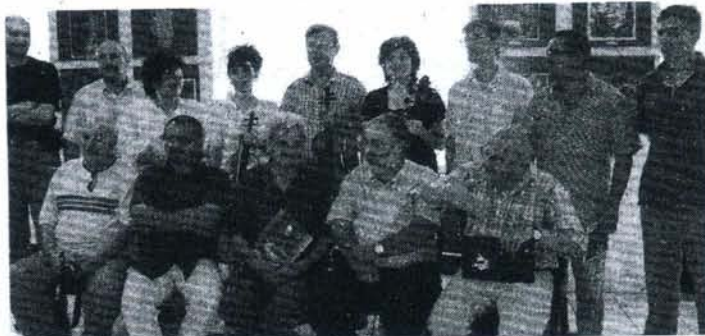
Vernisajul a avut loc ieri

Noua expoziție cuprinde portrete, nuduri, peisaje etc. și va rămâne la dispoziția publicului vizitator până în 22 august. Lucrările vor putea fi vizitate în zilele de lucru, între orele 8:00 și 19:00. Intrarea este gratuită. C.D.